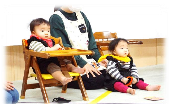
♪発表会予行練習の様子です。 練習を楽しんで参加していました！