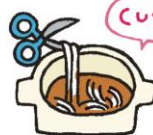
麺類は7~8cm くらいに切る