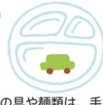
スープの具や麺類は、手づかみ食べ用の皿にのせる